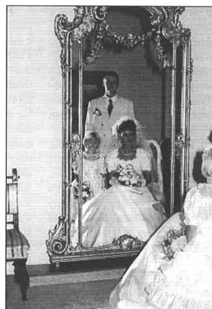
▲ ► Svatba v bílém působí v obřadní síni městského úřadu přímo pohádkově.