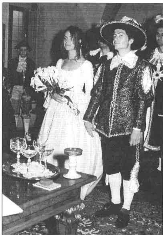
▲ Krojovaná francouzsko - česká svatba v obřadní síni na benešovském zámku byla pastvou pro oči.