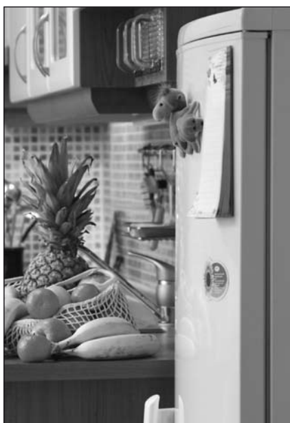
Lednice označená třídou A šetří nejen peníze, ale i životní prostředí

U praček je vybavenost domácností podobná, vlastní je 96 % z nich. Starších pěti let je 48 % praček.