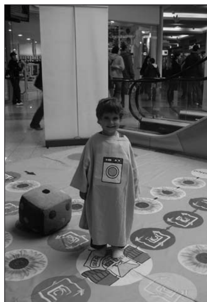
Na akcích Elektrowinu se děti učí, kam patří vysloužilé elektro

Každý z nás vyhodí za rok asi 150 - 200 kg odpadů. Pokud však odpady už doma třídíme a dáváme je do barevných kontejnerů, umožníme tak recyklaci více než třetiny tohoto množství. Za rok tak můžeme vytřídít až 30 kg papíru, 25 kg plastů, 15 kg skla. Pokud budeme jednotlivé druhy odpadů správně třídít, umožníme tak jejich další zpracování. Odpady, které vhodíme do barevného kontejneru, odveze velké svozové auto na dotřídňovací linku. Odtud putují do zpracovatelských firem, kde z odpadů vznikají nové výrobky - tento proces se nazývá recyklace odpadu. (zdroj: www.jaktridit.cz )