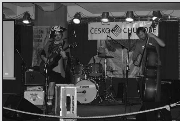
Kapela Kulturní Milan

http://www.ceskoprotichudobe.cz , http://www.zelenaproplanetu.cz , http://www.zambici.estranky.cz