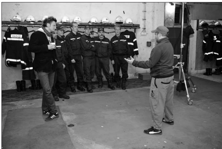
Benešov nad Ploučnicí