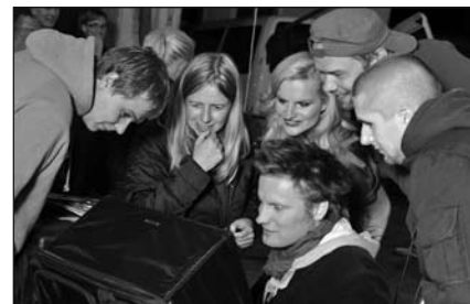
Benešov nad Ploučnicí