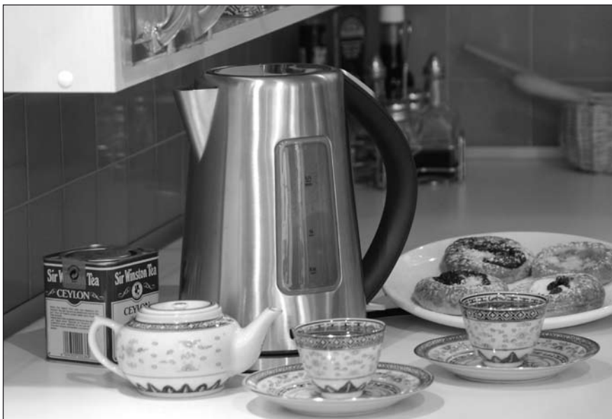
I moderní rychlovarná konvice může šetřit rozpočet domácnosti

Možná by stálo za to, sednout si a spočítat, kolik bychom v domácnosti ušetřili, kdybychom si koupili spotřebič nový, energeticky úsporný. I když jde jednorázově o nezanedbatelný výdaj, návratnost se kvůli rostoucím cenám energií výrazně zrychluje.