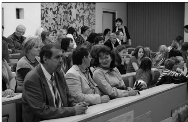
Vedení PF UJEP Ústí n. L. s ředitelkou školy