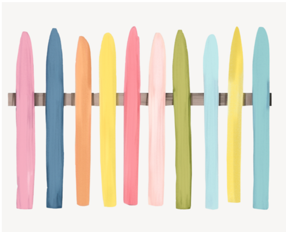
„Nové oplocení“ u MŠ - ilustrační foto.