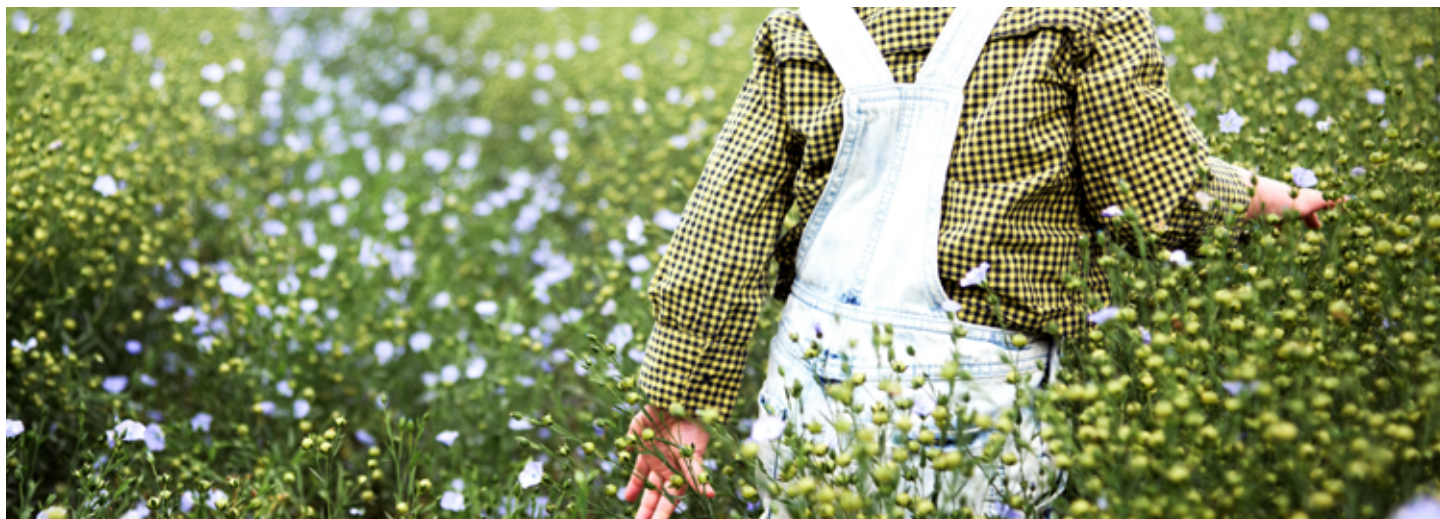
Ozelenění v areálu ZŠ - ilustrační foto.

Necháváme zpracovat strategický dokument „Místní energetickou koncepci města“.