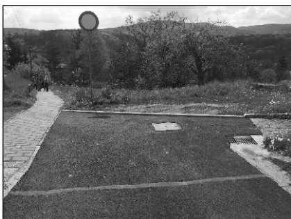
Oprava komunikace na Táborském vrchu.