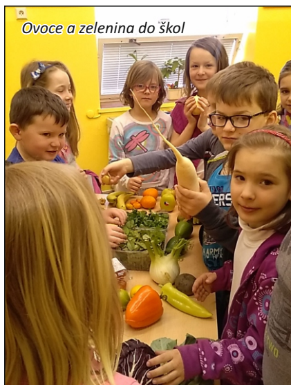
Ovoce a zelenina do škol