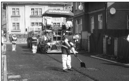
Ulice Tkalcovská a Kamenná se dočkala nových asfaltových povrchů.