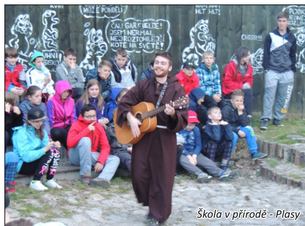
Škola v přírodě - Plasy