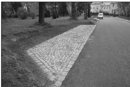
V ulici Opletalova došlo k dokončení parkovacích zálivů.