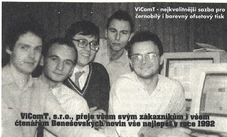
ViComT - nejkvalitnější sazba pro černobílý i barevný ofsetový tisk

ViComT, s.r.o., přeje všem svým zákazníkům i všem čtenářům Benešovských novin vše nejlepší v roce 1992