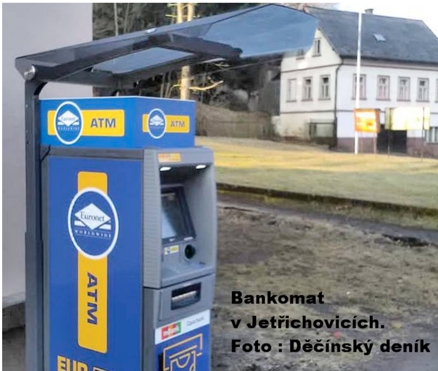
Bankomat v Jetřichovicích.