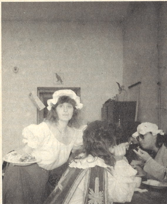
U supa se podávala skvělá jídla z kuchyně Jarka Mataje.