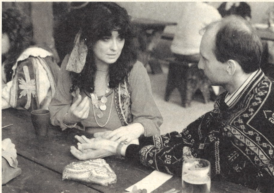
Krásná vědma čte z ruky soukromého podnikatele (z Benešovského Slunovratu)