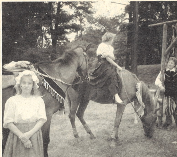
Benešovský Slunovrat v Zámeckém parku