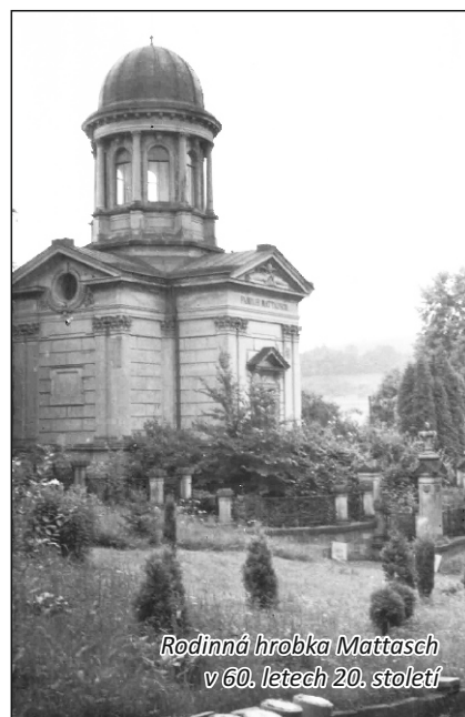
Rodinná hrobka Mattasch v 60. letech 20. století