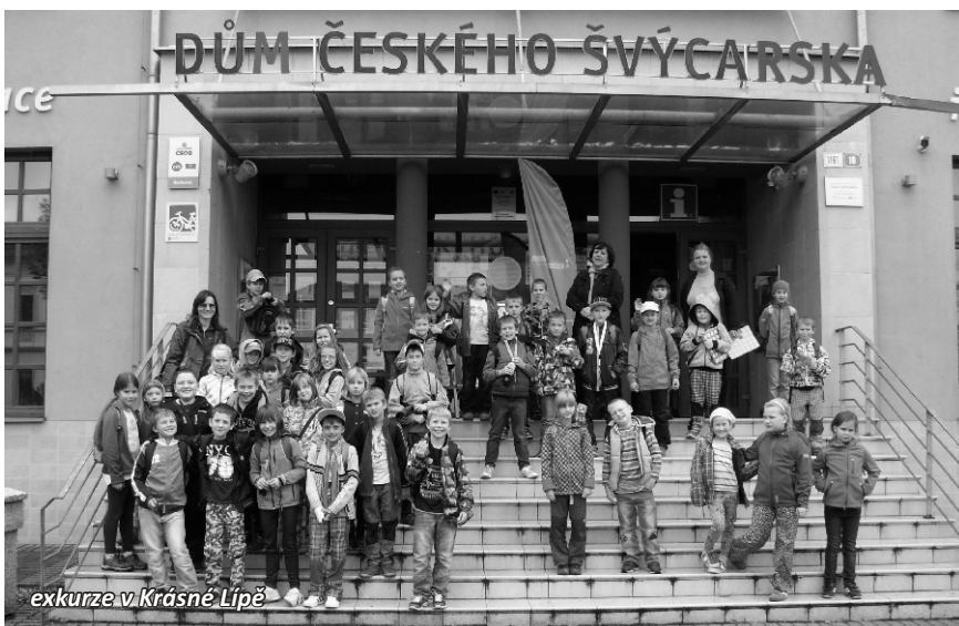
exkurze v Krásné Lípě