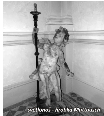
světlonoš - hrobka Mattausch