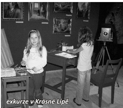
exkurze v Krásné Lípě