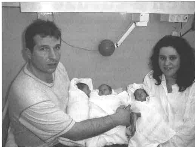
Trojnásobná radost před rokem...