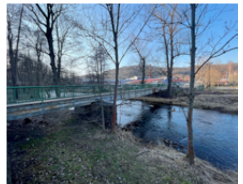
Lávka u koupaliště se dočká opravy.