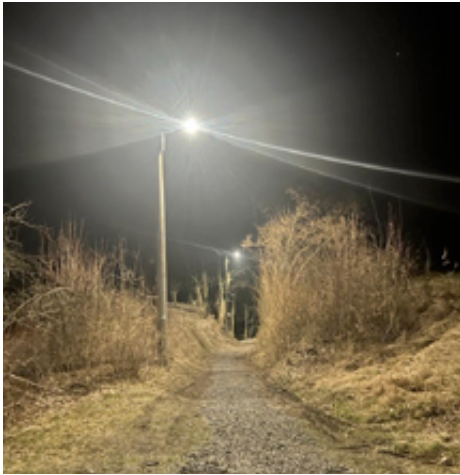
Nové osvětlení od zahrádek na Ovesnou.