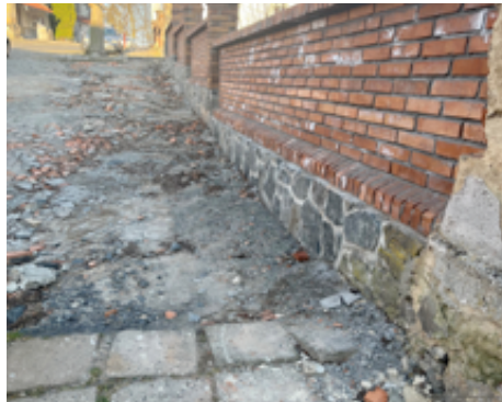
Oprava chodníků na sídlišti, v ul. Kostelní a v ul. Nerudova.

Příprava projektové dokumentace na zajištění závlahy fotbalového hřiště pomocí kopané studny a srážkových vod ze střechy.