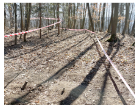
Příprava singletracku pro děti.