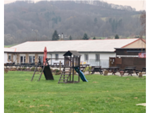
Budoucí rekonstrukce střechy na koupališti.

Proběhlo výběrové řízení na zhotovitele vrtu na Ovesné.