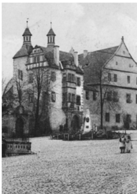
Pomník F. L. Jahna na náměstí.

Z knihy „Střípky z minulosti našeho města“