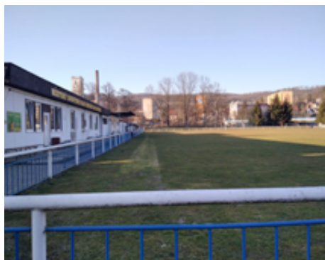
Fotbalové hřiště bude mít vlastní závlahování.

V nejbližších dnech začne výměna a doplnění mobiliáře na hřbitově o nové lavičky, zábradlí a stojany na konve. Bude provedena zpevněná plocha pod pítky apod.