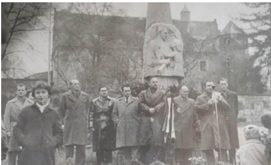
F. L. Jahn přetvořen v šedesátých letech na sovětského osvoboditele.

V rámci „očisty od nacismu“, kterou prováděli hned v prvních porevolučních dnech noví osídlenci, byl zbourán pomník obětem válek v parku pod školou a na stejném místě i pomník velkého německého básníka Fridricha Schillera (1759–1805). Z pomníku Fridricha Ludwiga Jahna na náměstí byly sňaty desky. F.L. Jahn (1778–1852) přezdívaný „Turnvater“ byl zakladatelem německého nářadového sportu. Jeho tělovýchovný systém se rozšířil nejen v Německu, ale i v naší monarchii včetně Čech. V roce 1816 vypracoval studii