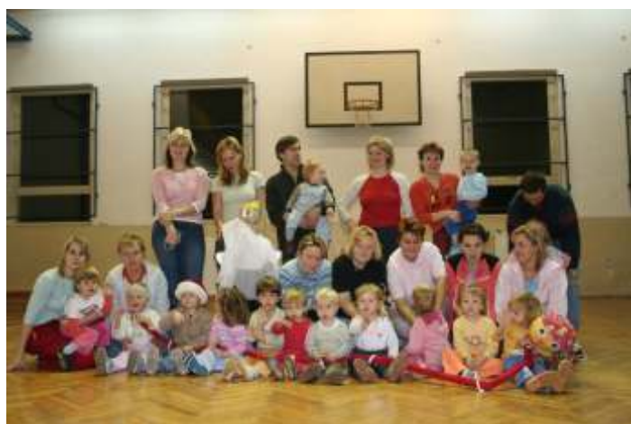
Každou středu protahuje své tělo až 17 malých neposedů.