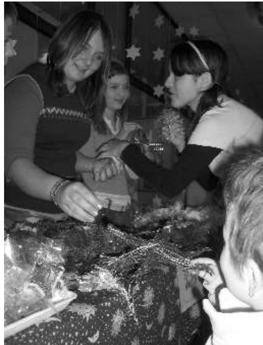
Možnost ukázat své šikovné ruce si na tradičním Vánočním jarmarku nenechala ujít ani jedna třída školy.