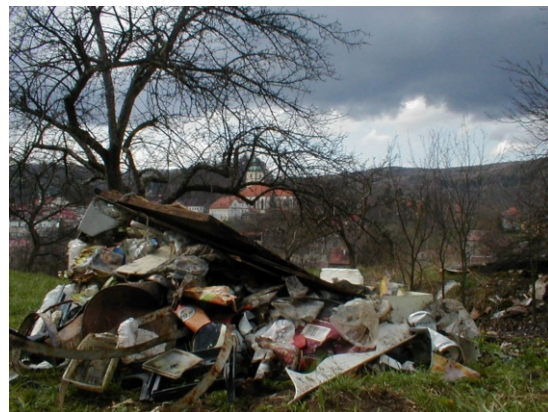
Pavel Měkuta, hospodář ZO 33/03 ČSOP