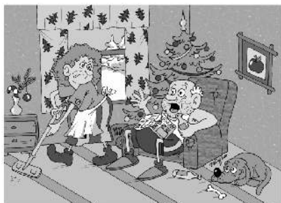
Nevím proč tak uklízíš? Ježíšek se přece narodil ve chlévě...

Platby za pronájem hrobových míst, bytů, nebytových prostor a pozemků jsou řešeny v jednotlivých uzavřených smlouvách, doporučujeme občanům, aby provedli také kontrolu těchto smluv. Veškeré informace k těmto závazkům Vám poskytnou pracovníce odboru správy majetku. Tel: 412 589 825-826