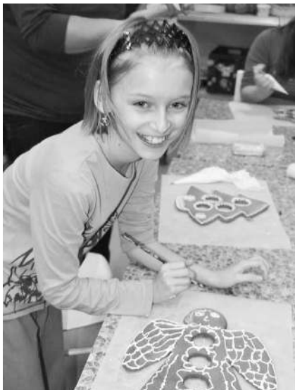
Z adventního tvoření.