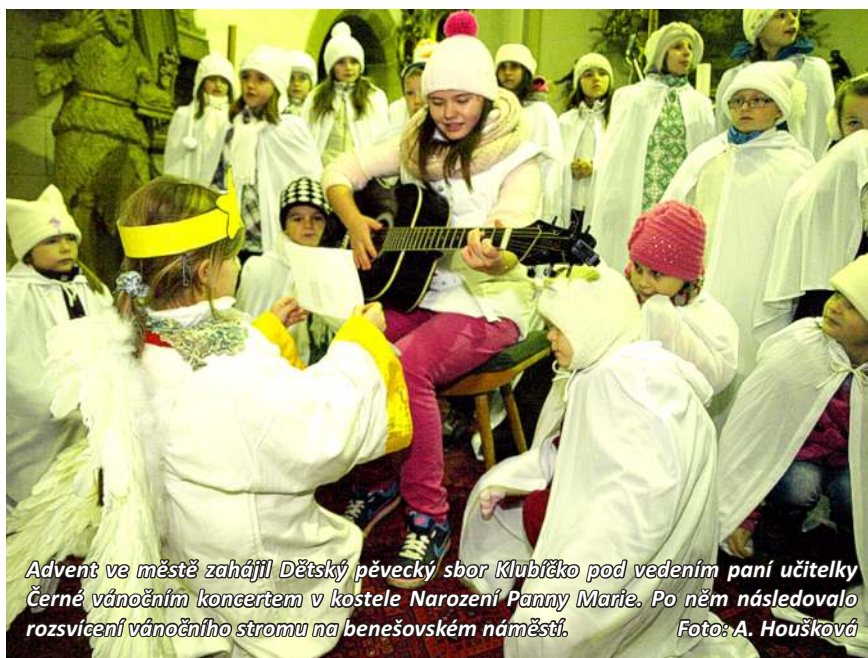
Advent ve městě zahájil Dětský pěvecký sbor Klubičko pod vedením paní učitelky Černé vánočním koncertem v kostele Narození Panny Marie. Po něm následovalo rozsvícení vánočního stromu na benešovském náměstí.

U příležitosti listopadového státního svátku byla uspořádána v prostorách galerie benešovské školy vernisáž, na které byla prezentována výtvarná díla a fotografie, vztahující se k dvěma mezinárodním projektům. Výstupem projektu škol pod názvem Náš svět byly vitrážové hodiny a velkoplošné fotografie, mapující olympijské hry, uspořádané mezi Základní školou Benešov nad Ploučnicí a Pestalozzi Gymnasiem Heidenau. Výstupem projektu seniorské spolupráce byly hodiny vytvořené pomocí látky zvané Paverpol. Výstava byla doplněna dvěma sochami, vytvořenými také z Paverpolu. Celá vernisáž byla pojata jako pozastavení nad plynoucím časem. V tentýž den byla v kině již tradiční akce Den úcty ke stáří, hostovala jsem zde se staršími občany města o aktivitách Klubu seniorů a byla jsem velmi potěšena. Klub funguje díky dobré partě lidí přesně podle původní vize. Lidé z klubu tráví společně dovolené, jezdí za sportem i kulturou, v prostorách klubu pořádají turnaje,