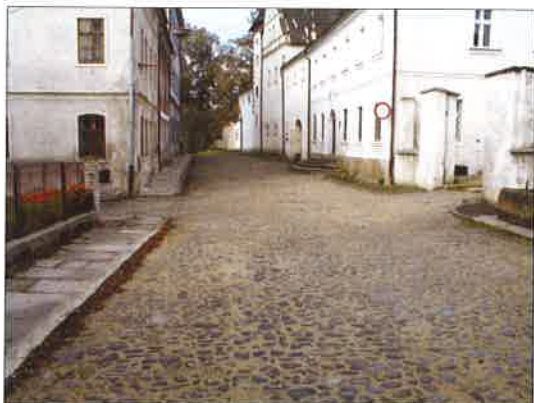
Nová dlažba v Zámecké ulici