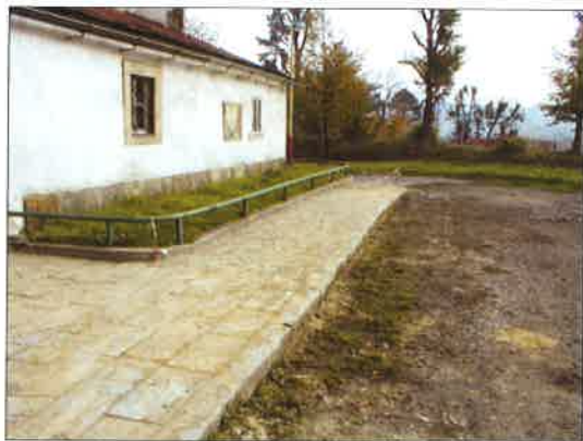
Nový chodník kolem kostela