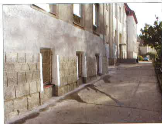
Oprava fasády na ZŠ