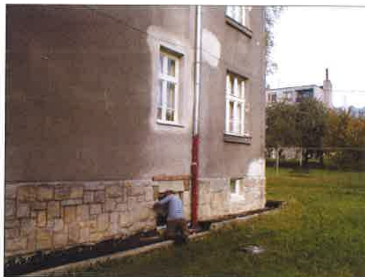
Oprava domu s pečovatelskou službou