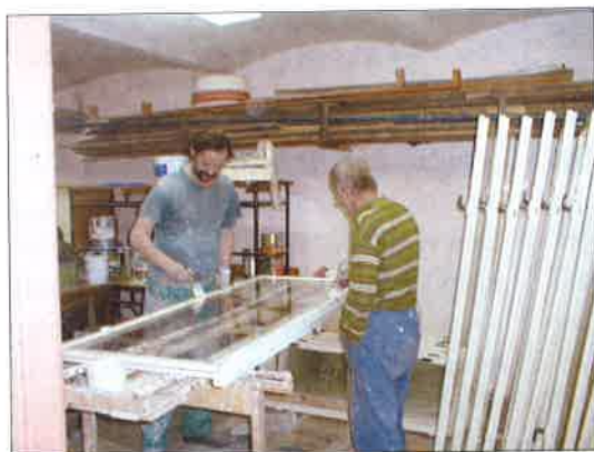
Nátěry oken ZŠ a MŠ

V nastoupeném trendu při opravách našich budov a zařízení budeme pokračovat i nadále, přičemž zejména při opravách obytných domů přivítáme i účast nájemníků bytů. Věříme, že touto formou se dá předejít vyšším nákladům v případě nutnosti rozsáhlých prací.