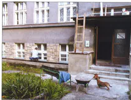
Oprava domu s pečovatelskou službou