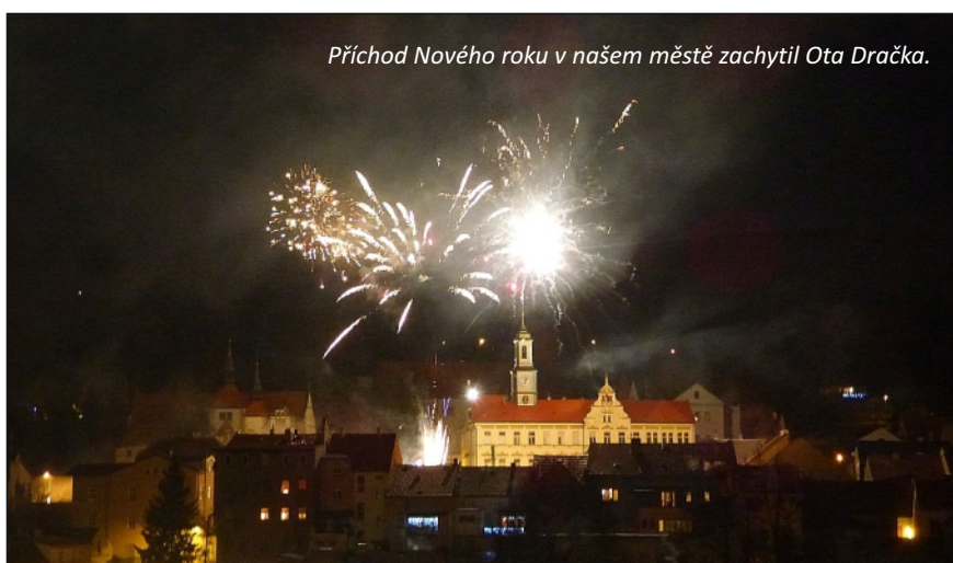
Příchod Nového roku v našem městě zachytil Ota Dračka.

Počet obyvatel v našem městě v loňském roce opět klesl. Tento trend trvá již posledních pár let. Dle statistiky evidence obyvatel bylo k 31. prosinci 2017 trvale hlášeno v našem městě celkem 3.710 obyvatel. To je oproti roku 2016 o 16 obyvatel méně. Z tohoto počtu je 3.000 dospělých, dětí do 18-ti let je v Benešově nad Ploučnicí 710. Věkový průměr současného Benešova je 42 let.