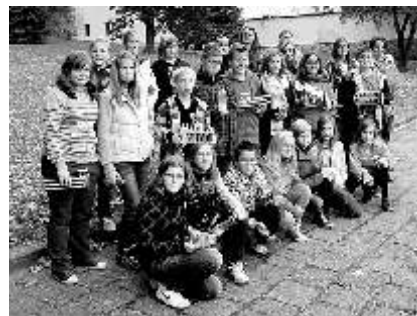
2 fotografie z výmenného pobytu.