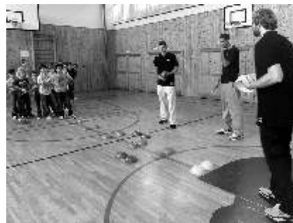
Z návštěvy vyhrála BK Dánska.