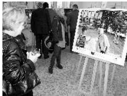
Z vernisáže výstavy 24. října.