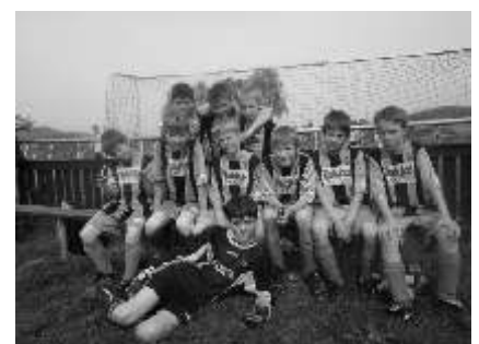
↑ McDonald's CUP