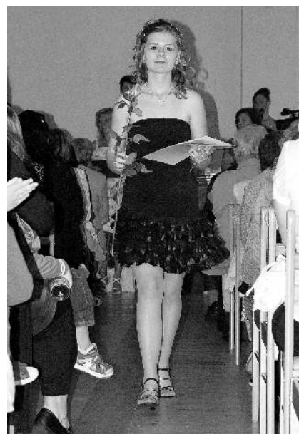
Ze slavnostního vyřazování deváťáků.

Máte zájem o inzerci v Benešovských novinách?