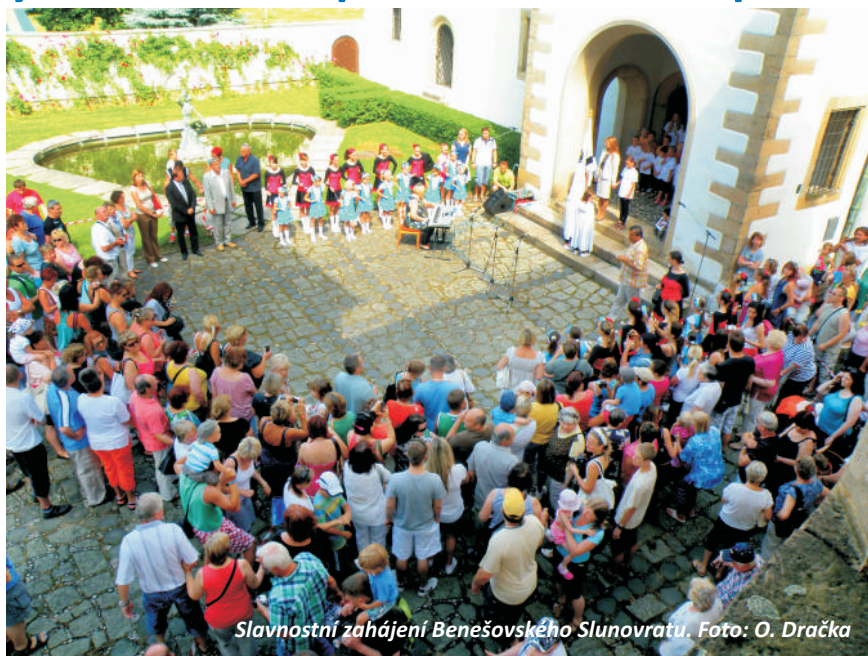
Slavnostní zahájení Benešovského Slunovratu.

V červnu byl slavnostním přestřizem pásky zahájen provoz nového centra benešovských hasičů.