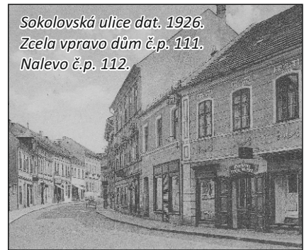
Sokolovská ulice dat. 1926. Zcela vpravo dům č.p. 111. Nalevo č.p. 112.

*před rokem 1863 bylo původní č.p. čísla 111 - 56 a domu č.p. 112 - 55