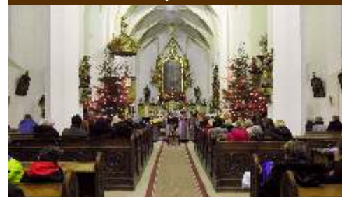
Tříkrálový koncert v kostele - SoliDeo