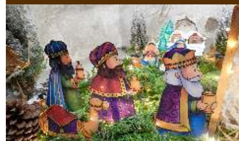
Betlém ve výklenku kostela