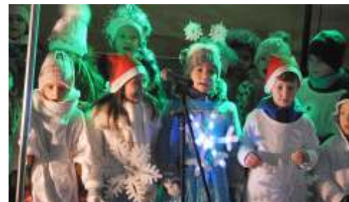
Rozsvícení vánočního stromu