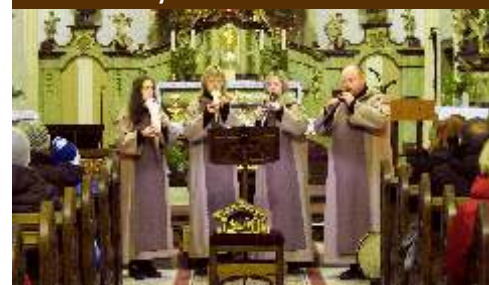
Tříkrálový koncert v kostele - SoliDeo