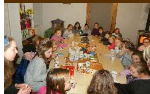
Zdobení betléma - setkání na faře