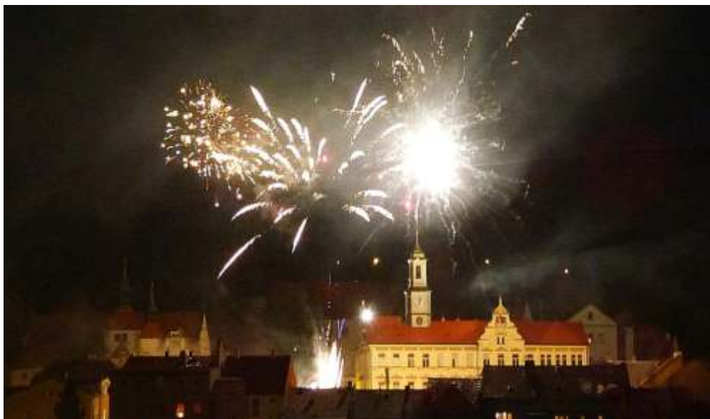
Přivítání roku 2019