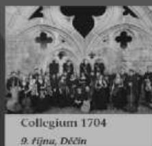
Collegium 1704 9. října, Děčín