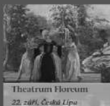
Theatrum Floreum 22. září, Česká Lípa