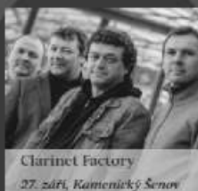
Clarinet Factory 27. září, Kamenický Šenov