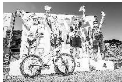
Stupně vítězů ve švýcarském Leibstadtu.