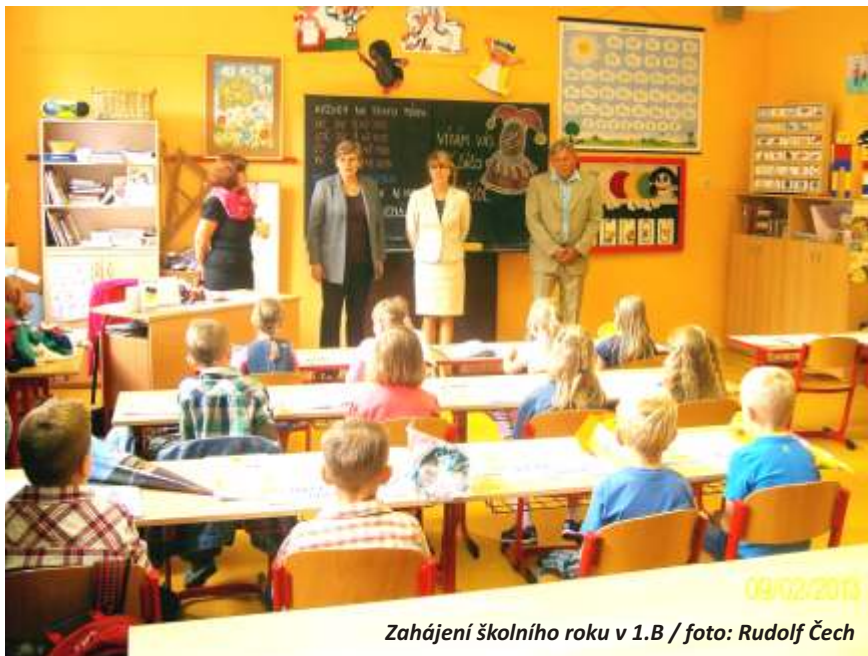
Zahájení školního roku v 1.B

Léto bylo ve znamení mnoha zajímavých akcí, především na benešovském zámku, kde se střídaly noční prohlídky s trhy, na městském koupališti i v městském kině. Začátek léta zastihl ve škole benešovské seniory na vzdělávacím kurzu výtvarného tvoření. Prostřednictvím tekuté látky paverpol vytvořili frekventanti plastiku, do které umístili hodinový strojek. Hned po seniorských se ve výtvarných dílnách školy sešla dvacítka nadšenců k výtvarnému tvoření vitráží tiffany, rovněž s cílem vytvořit časostroj. Obě skupiny výtvarníků vytvořily velmi zajímavá a inspirující díla, která budou k vidění na podzimní výstavě. Výtvarné vzdělávací kurzy jsou pořádány za podpory Evropských fondů, program Cíl3, Euroregion Elbe Labe. Seniorský projekt Spolupráce pokračoval v srpnu plaveckými a šipkařskými