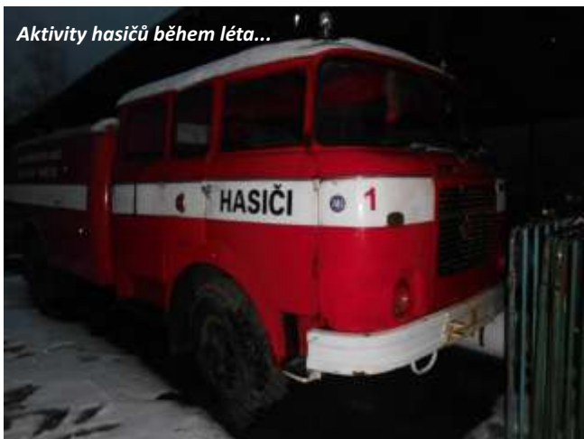
Aktivity hasičů během léta...