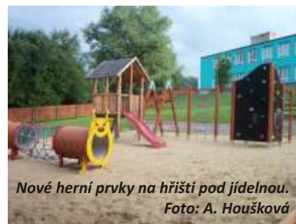
Nové herní prvky na hřišti pod jídelnou.