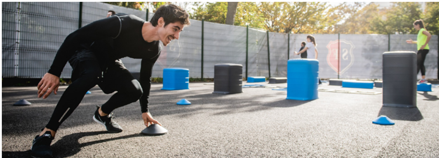
Workoutové hřiště - ilustrační foto.

Máme připravenou projektovou dokumentaci na revitalizaci hřiště ve Wolkerově ulici. Nově by zde mělo vzniknout víceúčelové a workoutové hřiště.