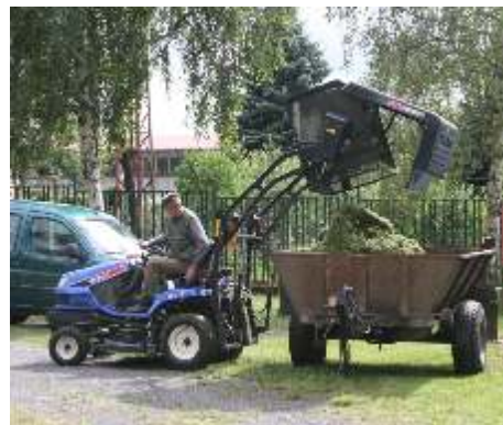
Nová seka ka pomáhá p í údržb ve ejné zelen .