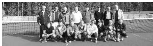
Foto z turnaje ve čtyřhrách.